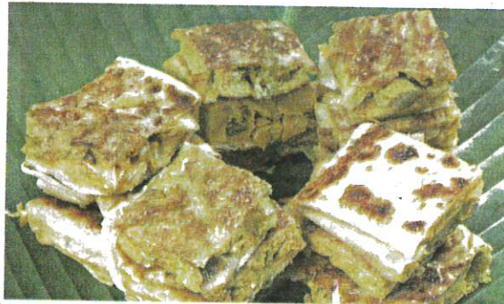
Seorang wanita di Kuala Krai mendakwa termakan martabak yang intinya mengandungi lipas pada Ahad. Gambar hiasan

"Saya terus muntah dan hilang selera makan kerana terbayang lipas berada di dalam mulut. Sangat